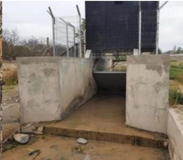
Foto 2. Canal Ahumada.