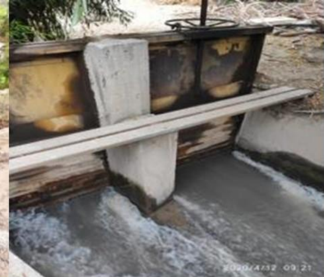
Foto 4. Canal El Cerro.