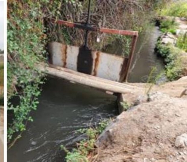
Foto 3. Canal Purehue.