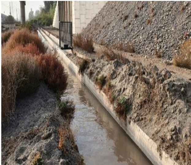
Foto 1. Canal La Pirca.