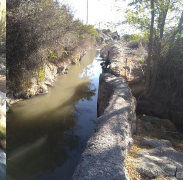
Foto 4. Canal Echeverría.