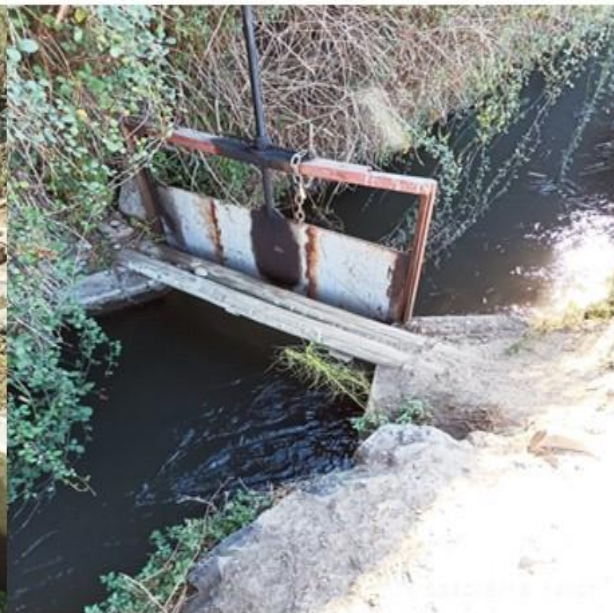
Foto 2. Canal Purehue.