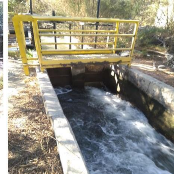
Foto 3. Canal Las Vegas.