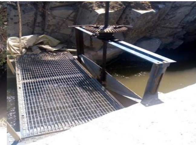
Foto 4. Canal La Sombra.