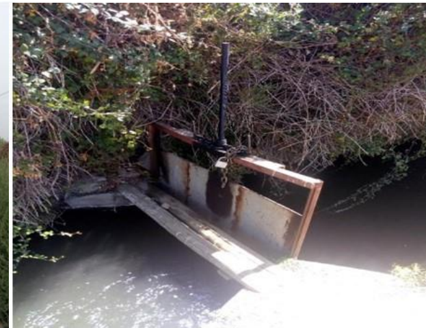
Foto 3. Canal Purehue.