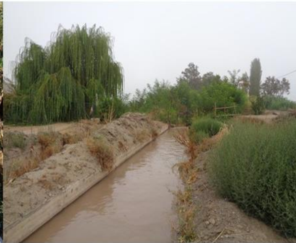
Foto 2. Canal La Pirca.