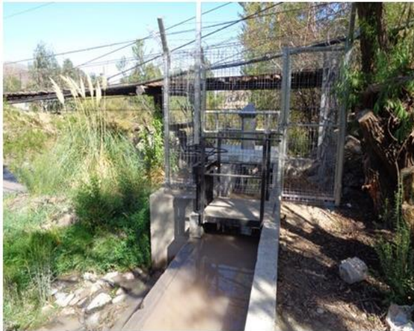
Foto 1. Canal Chacayes.