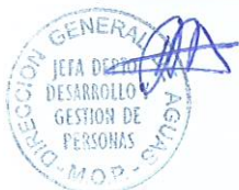
RODRIGO SANHUEZA BRAVO Director General de Aguas Ministerio de Obras Públicas