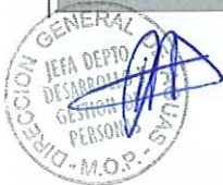
RODRIGO SANHUEZA BRAVO Director General de Aguas Ministerio de Obras Públicas