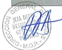
RODRIGO SANHUEZA BRAVO Director General de Aguas Ministerio de Obras Públicas