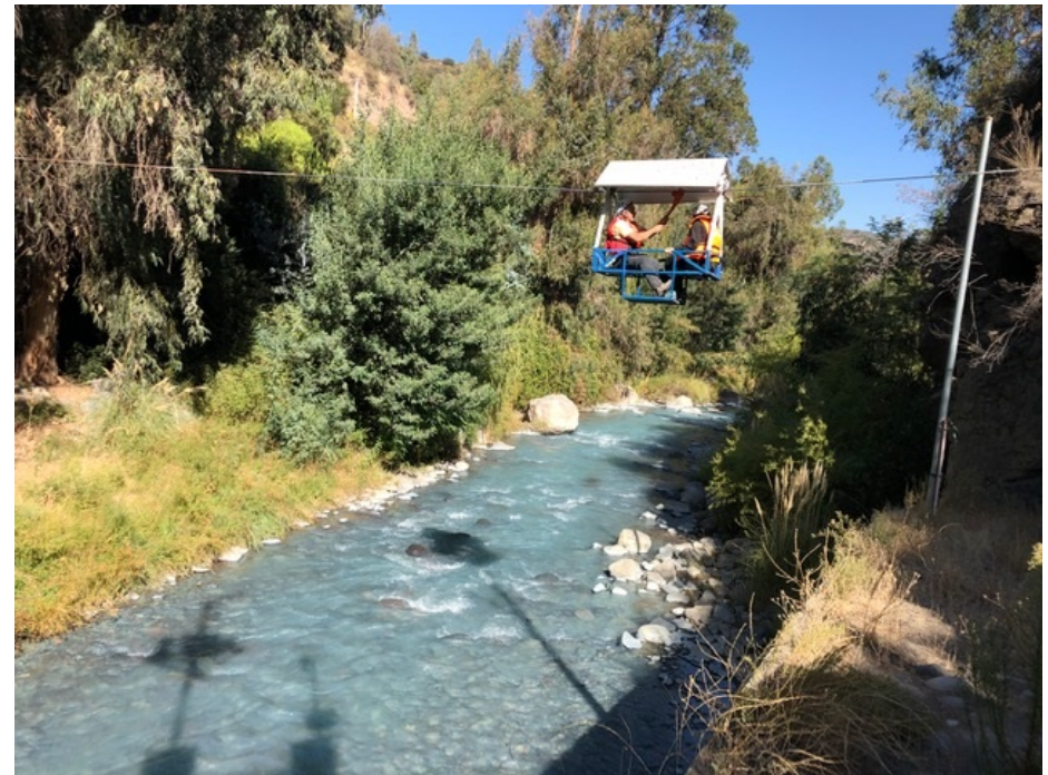
Estación Río Mapocho en Los Almendros